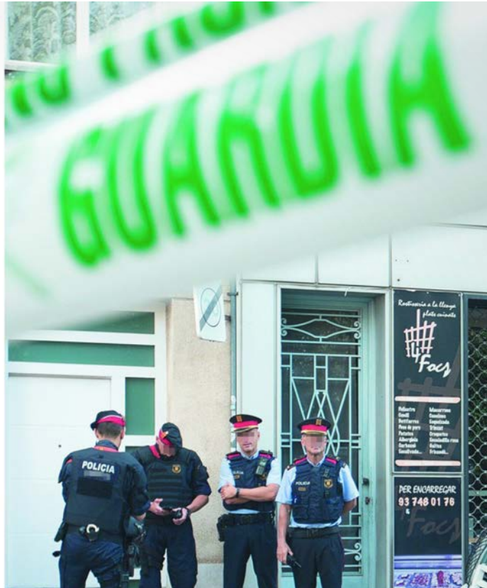
LA RAZÓN • Sábado, 24 de abril de 2021

También, aunque prefiere guardar el anonimato y por ello rechaza que salga su nombre, está el caso de un guardia civil de 37 años con una enfermedad crónica y que está destinado en el